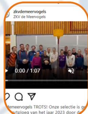
3. De nominatie voor sportploeg van het jaar (72 hartjes)