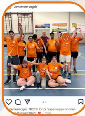
1. De eerste oefenwedstrijd van de Supervogels (81 hartjes)

Bij de vorige JAV hadden we 647 Instagram-volgers, dit jaar zijn dat er 714, een stabiele groei van 10%. De posts die het afgelopen seizoen de meest hartjes van jullie kregen waren: