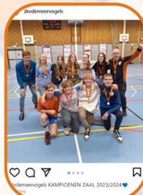
2. De zaalkampioenpost (78 hartjes)